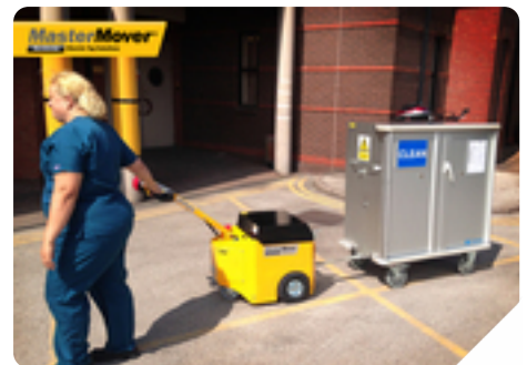
Mașină: AT300 TOW Tipul unității: Sănătate