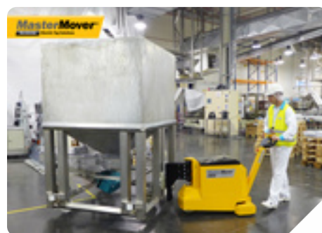
Zariadenie: MT400+ Druh podnikania: Potravinárstvo