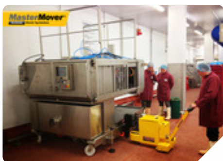
Zariadenie: MT300+ Druh podnikania: Potravinárstvo