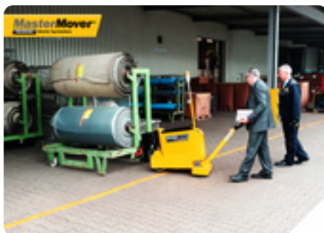
Tipo di macchinario: MT400+ Tipologia di azienda: Industria tessile Client: Optibelt