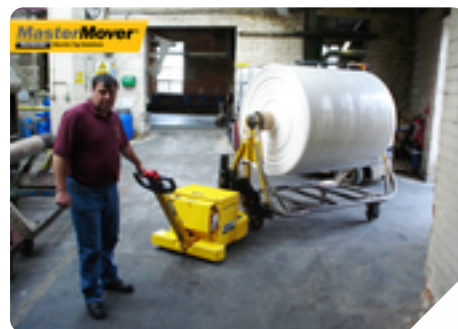
Tipo di macchinario: Tipologia di azienda: Industria tessile