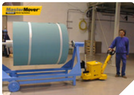
Tipo di macchinario: MT300+ Tipologia di azienda: Industria tessile