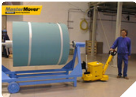
Máquina: MT300+ Tipo de negócio: Indústria têxtil