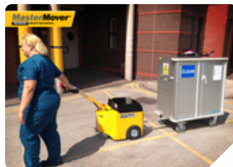
Máquina: AT300 TOW Tipo de negócio: Hospitalar