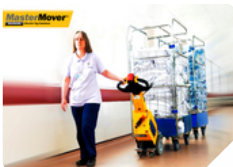
Máquina: SM100 Tipo de negócio: Hospitalar